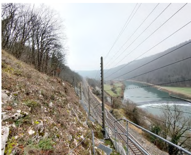
Travaux de maîtrise de la végétation sur parois rocheuses

Ces travaux mobilisent en moyenne 8 agents ainsi qu'une entreprise locale, Rambaud Forêt, spécialiste dans les travaux forestiers située aux Premiers-Sapins (25). Ce chantier, financé par SNCF Réseau, est de 200 000€.