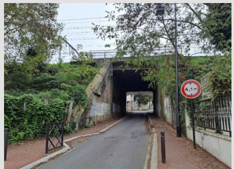
Photo du pont-rail