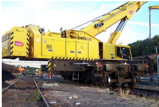
La GRUE KIROW SNCF RESEAU : pesant 36 tonnes, elle est capable de lever jusqu'à 100 tonnes de charge.