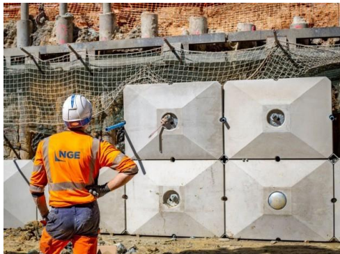
Un agent de NGE devant des écailles de béton – photo d'illustration issue du chantier de Sèvres (mars 2020).