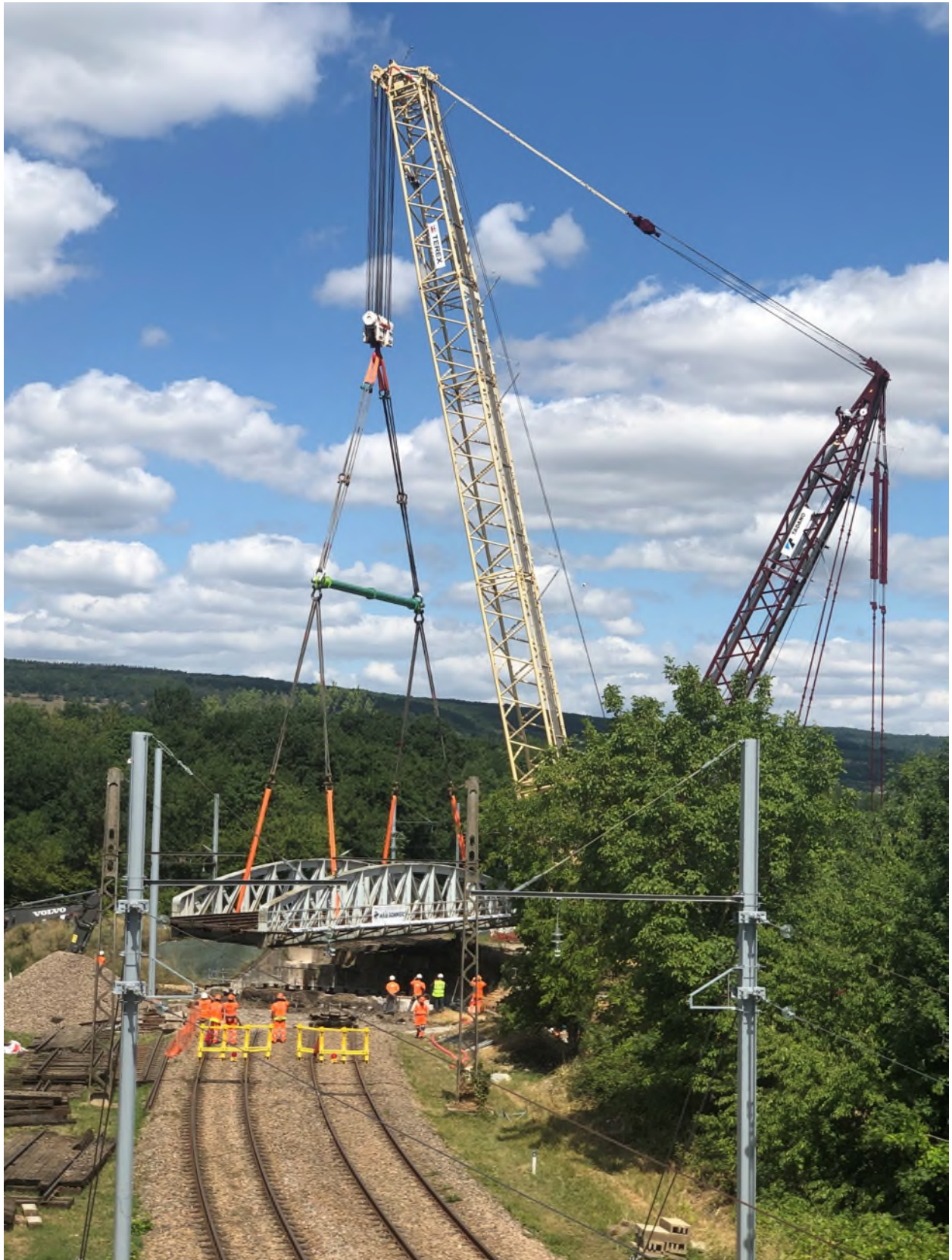
Le pont est déposé à l'aide de la grue