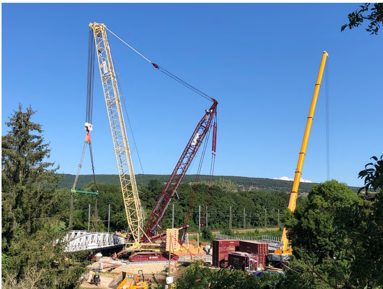
Vue d'ensemble du chantier