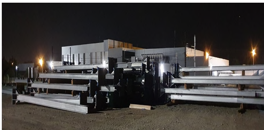
Photos prises en Occitanie chantier de nuit 2021