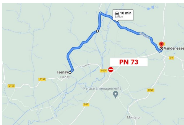
Déviation par la RD 106