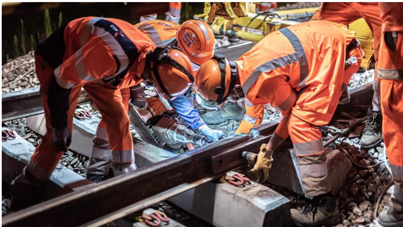
Remplacement des traverses