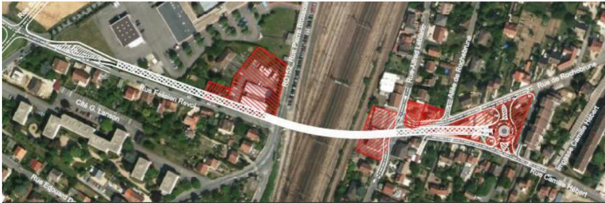
Projet de suppression du PN n°23 du 1 er programme

De 2016 à 2018, un nouveau projet a été étudié mais finalement abandonné pour les mêmes raisons. Il s'agissait alors de créer un saut-de-mouton et un nouveau quai pour augmenter le nombre de dessertes.