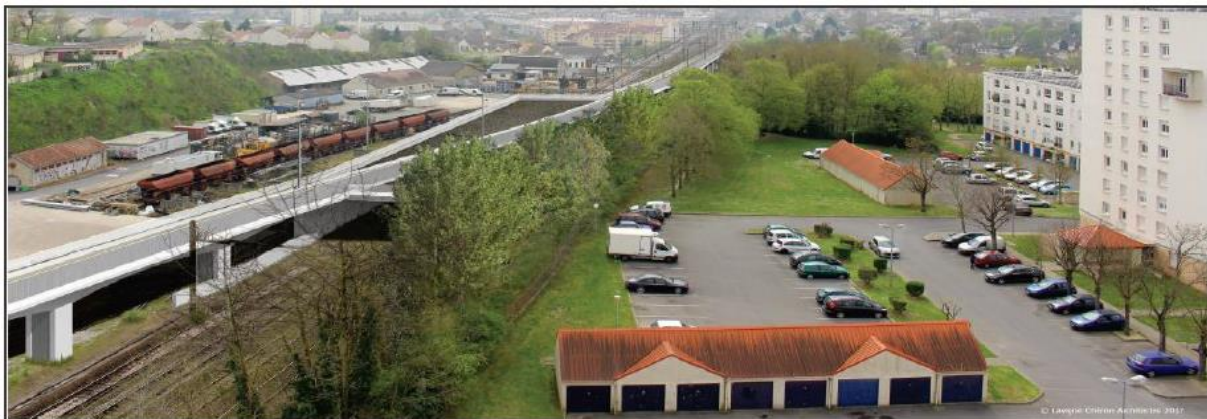
Projet de saut-de-mouton du 2 ème programme

De 2016 à 2018, un nouveau projet a été étudié mais finalement abandonné pour les mêmes raisons. Il s'agissait alors de créer un saut-de-mouton et un nouveau quai pour augmenter le nombre de dessertes.