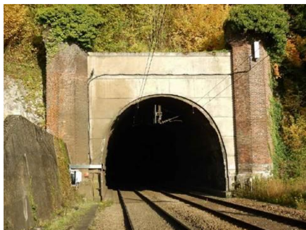
Entrée du tunnel du roule côté Paris