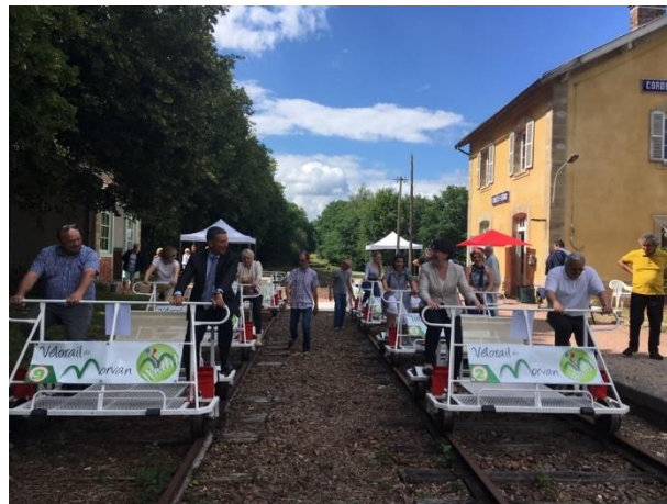
Vélorail du Morvan

D'autres projets ont vu le jour en Bourgogne-Franche-Comté, avec notamment la voie verte de Villersexel sur 38 km entre Montbozon à Lure ou encore avec le vélorail de la Vingeanne sur 6,4 km reliant Saint-Julien à Gray.