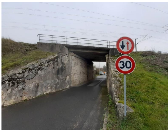
Réfection de l'étanchéité d'un pont-rail situé sur la commune de Neuvy-sur-Loire

Sur cette période, des limitations temporaires de vitesse des trains auront lieu ainsi qu'une coupure de ligne entre Montargis et Cosne-sur-Loire du vendredi 11 juin à 22h au lundi 14 juin à 4h. Ce chantier représente un investissement de 320 000 € financés par SNCF Réseau.