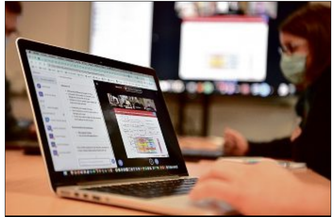
ORDINATEUR. Cinquante machines vont être distribuées aux étudiants.

L'université de Limoges et le Conseil régional avaient déjà mené une action similaire pour fournir