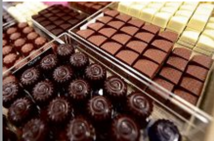
CHOCOLAT. Chocolaterie centenaire, Buisnière a mis en place de nouveaux services.

UN PEU DE DOUCEUR... Vous ne comptez pas vous passer de chocolats, pralinés, marrons glacés, ni de guimauves enrobées pour les fêtes ? Non, bien sûr. Et ça tombe bien. Buisnière, la chocolaterie centenaire, compte bien vous permettre de succomber à la tentation. Pour vous, elle a mis en place de nouveaux services : commande par téléphone ou en boutique, planification du retrait de sa commande sur rendez-vous, assortiments personnalisés à distance ou sur place. Ces services sur-mesure se multiplient pour que vos emplettes se fassent pratiques et rapides. Et histoire de sécuriser encore plus vos achats, « toutes les étapes de la fabrication du chocolat sont réalisées par la Maison afin de garantir la régularité, les qualités gustatives et