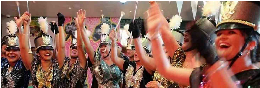
Elles dansent et défilent devant le public, mais ces spectacles, elles les font avant tout pour elles.

Dans le cadre de la collection Senior Power, gros plan ce soir sur France 3 Occitanie sur les Majors Girls de Montpellier. Cette troupe de majorettes a la particularité de ne compter dans ses rangs quasiment que des grands-mères.