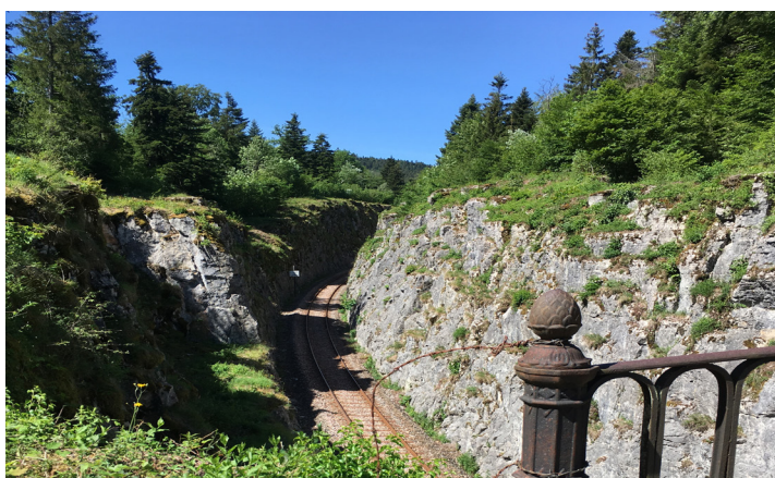
Tranchée du Vaudioux

SNCF Réseau, gestionnaire du réseau ferré national, entreprend des travaux de modernisation sur la ligne des Hironnelles entre Champagnole et Saint-Claude.