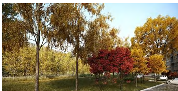
Vue du mur 5 ans après les travaux