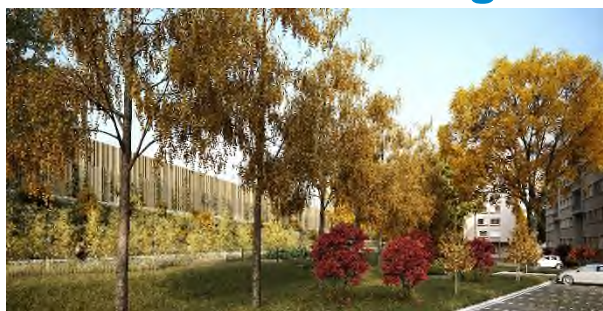
Vue du mur à la fin des travaux