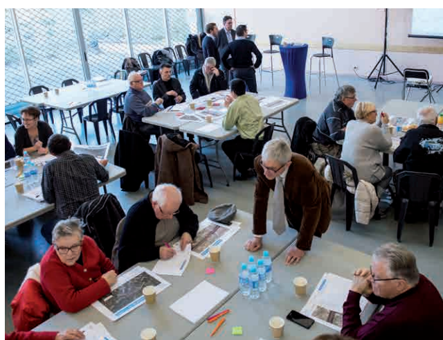
> L'ATELIER RIVERAINS À VILLIERS-SUR-MARNE