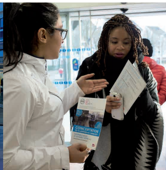
> LA RENCONTRE VOYAGEURS À ROISSY-EN-BRIE