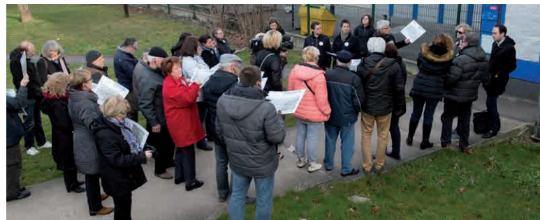
> VISITE DE TERRAIN AVEC LES RIVERAINS À NOISY-LE-GRAND