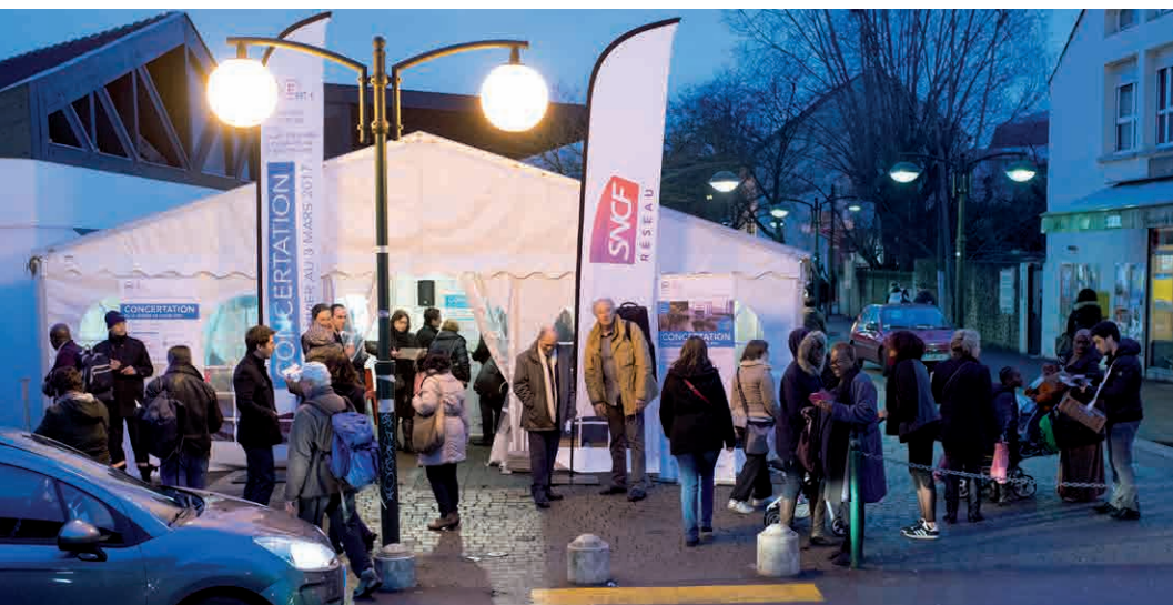
> LA RENCONTRE DE PROXIMITÉ À PONTAULT-COMBAULT