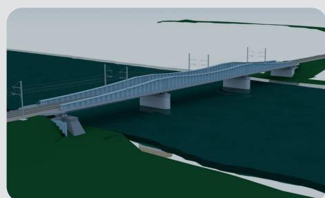
Image projetée du pont-rail à la fin des travaux