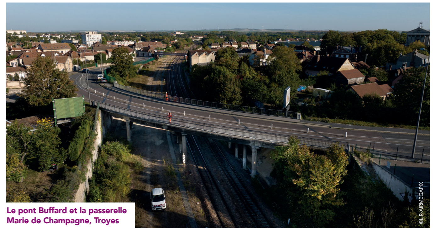
Le pont Buffard et la passerelle Marie de Champagne, Troyes

Du 30 avril au 30 octobre 2026 , la passerelle piétonne Marie de Champagne sera fermée. Du 30 avril 2026 au 7 mai 2027 , la route sera barrée de part et d'autre du pont Buffard. Retrouvez dans ce document toutes les informations pour faciliter vos déplacements durant les travaux.