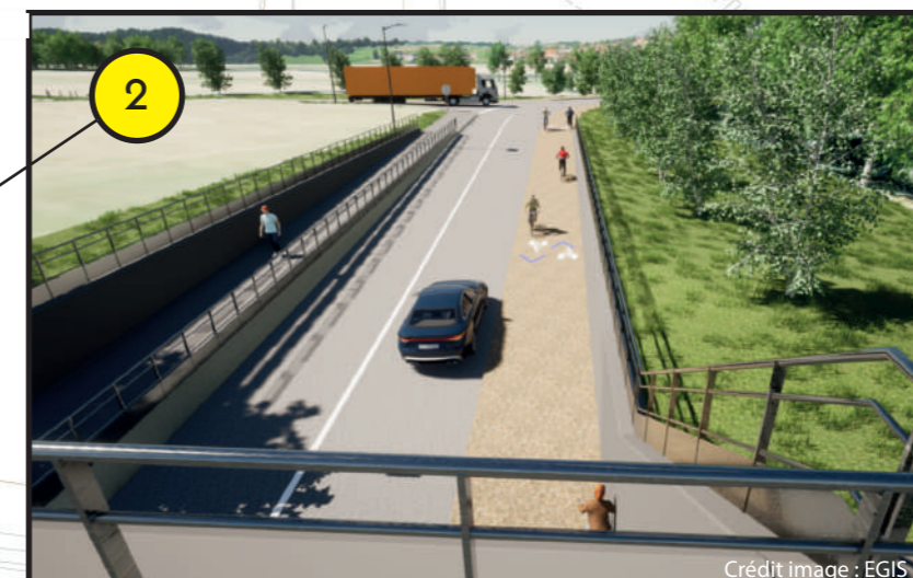
Vue depuis le dessus de la Trémie