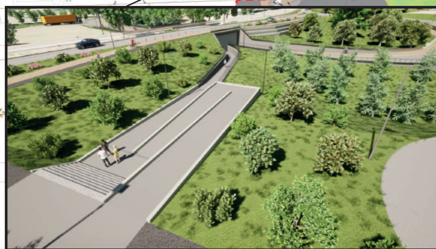
Vue de la rampe pour personnes à mobilité réduite