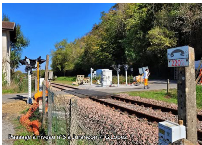
Passage à niveau n°6 à Jurançon

Dans le cadre de la procédure de mise en compatibilité des documents d'urbanisme (MECDU), SNCF Réseau a organisé des visites de terrain et des temps d'échanges les mercredi 12 et jeudi 13 novembre 2025 avec les élus des quatre communes ( Jurançon, Escot, Cette-Eygun et Urdos ) dont les documents d'urbanisme devront être modifiés pour rendre possible la réalisation du projet.