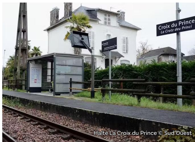
Halte La Croix du Prince

Dans le cadre de la procédure de mise en compatibilité des documents d'urbanisme (MECDU), SNCF Réseau a organisé des visites de terrain et des temps d'échanges les mercredi 12 et jeudi 13 novembre 2025 avec les élus des quatre communes ( Jurançon, Escot, Cette-Eygun et Urdos ) dont les documents d'urbanisme devront être modifiés pour rendre possible la réalisation du projet.