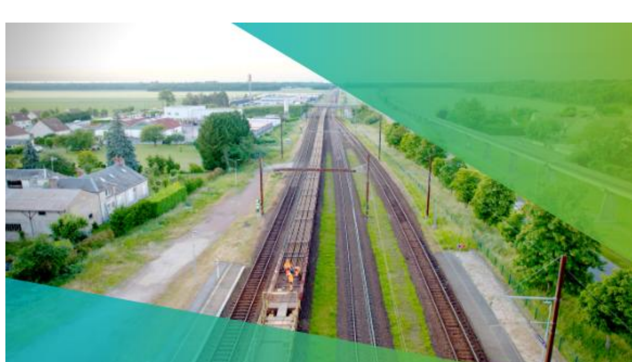
Déchargement des longs rails soudés à Château-Gaillard durant le week-end de l'Ascension, du 29 mai au 1 er juin 2025.

Les rails neufs arrivent par train jusqu'au chantier, en barres de 432 mètres . Celles-ci sont ensuite déchargées en ligne depuis une rame spéciale. Afin que leur production émette moins de CO2, les rails employés sont issus d'acier revalorisé dans des filières spécialisées. En tout, ce sont 6 000 tonnes de rails neufs qui seront posées et autant qui seront recyclées dans une aciérie française ultramoderne (Ascoval).