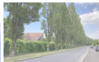
État existant - juin 2024

Photo de la vue projetée – Rue du Chemin de fer